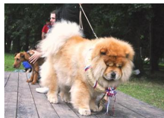
Víťaz international dog festu 2011/Az idei kutyakialitás bajnoka

Vysadené okrasné kvetiny a skalka v križovatke Gomboš, železničná stanica križovatke Gomboš, železničná stanica, na hlavnú, ktorá bola nedotknutá už niekoľko rokov. Zaujímavosťou je, že po vysadení sa kvetiny tak zapáčili, že ich niektorí občania chceli mať hneď doma, a tak sme museli inštalovať monitorovacie zariadenie.