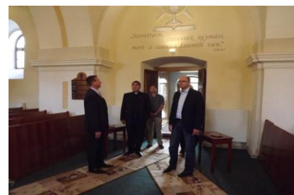
Richard Sulík (Predseda NR SR)

v nádhernom prostredí, ktorá sa v minulosti konala pravidelne a dúfame, že sa hlavný organizátor rozhodne pre Veľkú Idu aj v budúcnosti. Aktívni boli aj naši drobných chovateľov, ktorí usporiadali dňa 23.- 25. 09. 2011 v areáli kaštieľa krajskú výstavu kožušinových zvierat a medzikrajskú výstavu králikov - miestnu výstavu zvierat. Počas týchto výstav usporiadali 8. ročník súťaže vo varení. Ako vidíte obec Veľká Ida je bohatá na kultúrne a spoločenské podujatia, za ktorým je veľa