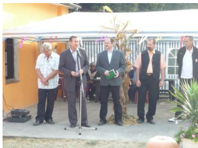
Zsolt Simon (Minister pôdohosp.)

Ďalšími významnými udalosťami v našej obci boli: športový deň 9.7.2011 a Medzinárodná výstava psov 23.- 24. 07. 2011, ktorého sa zúčastnilo okolo 1700 vystavovateľov. Krásna akcia,