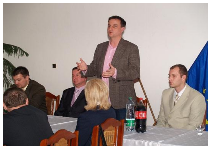
Daniel Krajcer (Minister kultúry SR)

Úvodom tohtoročného vydania obecných novín by sme chceli úspešne nadviazať na predošlé vydania bývalého vedenia obce a informovať občanov o dianí a novinkách v našej obci. Túto tradíciu chceme zachovať aj v budúcnosti a pravidelne vydávať tieto obecné noviny v každom kvartáli, čiže každý štvrt'rok. Vznik tohto informátora môže byť mnoho krát ovplyvnený našimi pracovnými povinnosťami, ktorých je stále viac než dosť, preto Vás žiadame vážení občania, aby ste boli voči nám - vedeniu obce, za náhodné omeškanie vydania zhovievaví. Vedenie obce ako aj našich poslancov a ich obvody predstavím neskôr. Tento rok bol na udalosti v našej obci bohatý. Boli sme svedkami výnimočných návštev, výstav, výročí, festivalov, rekonštrukcií, ale aj smutných prípadov. Poďme pekne po poriadku.